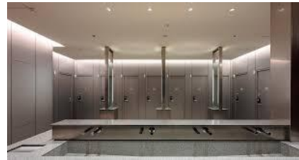
ジェンダーレストイレ (イギリス)

解決策 : より深く考える場を学校等でも設けるほか、 本当に効果的な活動ができているかを確認する機会を設ける。(後述した通り、現在LGBT政策のように効果的な活動が出来ていない可能性を考慮。)