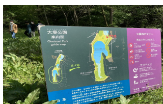
◀大堤沼公園の地図