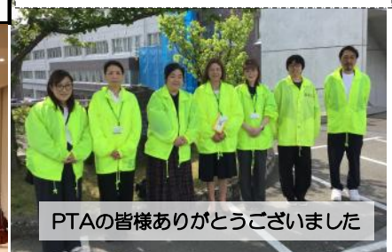
PTAの皆様ありがとうございました