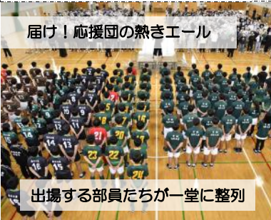
届け！応援団の熱きエール