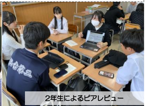
2年生によるピアレビュー