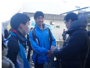
右：握手でパワー注入！