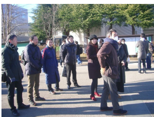
左：先生方もスタンバイ！