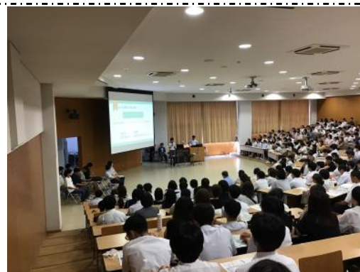
▲満員の会場で三高生が三高の魅力を語ります！

説明会後は、実行委員が校舎の各所に立って、道案内をする他、説明会では語りきれなかった三高の魅力を中学生やその保護者にお話ししました。現役三高生の“リアル”な声を聞けたことで、多くの中学生が三高の魅力に気づけたことでしょう。