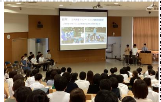
▲満員の会場で三高生が三高の魅力を語ります！

校舎のあちこちで中学生やその保護者と実行委員会が話し込む姿がみられ、例年以上に三高の魅力を発信できました。多くの中学生に「こんな三高生になりたい！」と聞いていただけたことでしょうか！