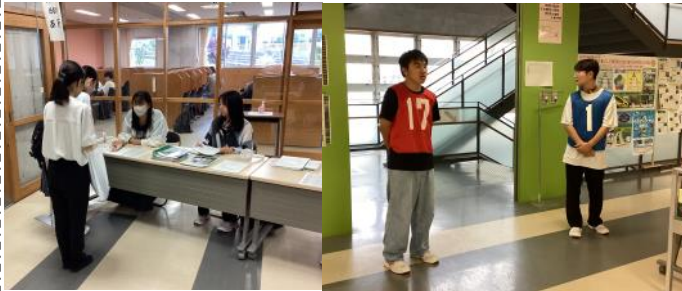
▲受付から生徒がお出迎え

そして何より、今年度は学校説明会実行委員会を中心に、現役三高生が三高の授業や学校行事、部活動への熱心な取り組みを参加者に伝えました。説明会後は、実行委員会が校舎内の各所に立ち、図書館や食堂、体育館といった施設を普段ど