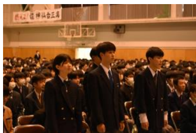
呼名に返事をして立ち上がる新入生

創立60周年という歴史の中で培われた本校の 「よき伝統」を生かしつつ、「新たな時代の流 れ」もしっかりとつかみながら、『チーム仙台三 高』として本校ならではの取組をさらに充実させ ていきたいと考えています。是非、これからも仙 台三高にご注目ください。