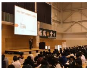
久しぶりに3学年一堂に会して講話を聞くことができました!

仙台三高のOBは、このように社会の様々なところで活躍されています。今年度は60周年記念行事も予定されています。ますます仙台三高が発展していく姿に期待が寄せられます。