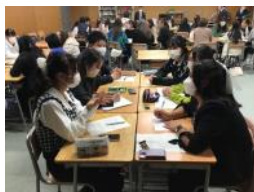
英語で意見交換の様子

ハワイ大学の皆さんとは両国の高校生活や学習スタイルの違いなど教育に関するを中心に意見交換をしました。大学や留学など進路に関するアドバイスもしていただきました。アメリカは学生が清掃をする習慣がないため、その光景に衝撃を受けていた様子が印象に残っています。私も皆さんの意欲的な姿勢を見習って、英語はもちろん、自分の考えを伝える努力をしなければと思う良いきっかけになりました。