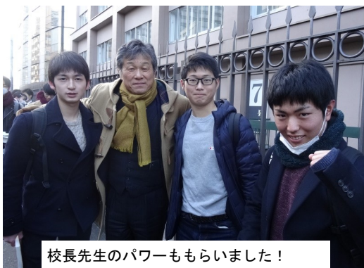
校長先生のパワーももらいました！

19日、20日に実施された大学入試センター試験。この時期ならではの寒さと強風にも屈することなく、本校生徒たちは無事に受験を終えました。気になる本校の自己採点結果ですが、文系が645.6点、理系で623.1点の平均点でした。過去最高であった昨年と比べ、文系では同等、理系ではさらに上回りました。しかし担任に相談し、慎重に判断をして出願する事に変更はありません。