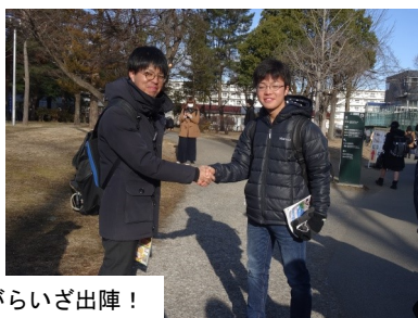
先生たちの激励を受けながらいざ出陣！