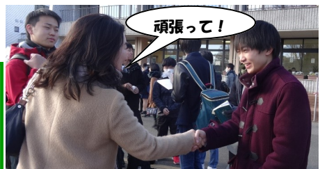
チーム三高で最後まで！