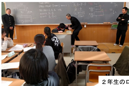
2年生のロールプレイングの様子

相手の立場に立って考え、行動することが一番大切だと思う。そうすれば、相手が嫌がる「いじめ」と皆が楽しめる「いじり」との区別をつけることができる。また、万が一、「いじめ」を見つけたとき、しっかり止められる人がいることも大事だと思う。そういう人が複数人いれば止めに入った人が次の標的になることなく「いじめ」がなくなると思う。「いじり」と「いじめ」の境界線は、する人ではなく、される人とそれを見ている人の判断によって引かれることが多いので、「これは大丈夫だろう」という主観的な考え方をしないようにしたい。