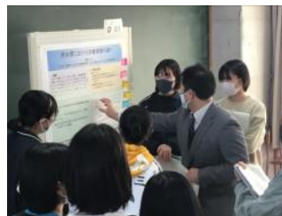
SS探究Ⅰのポスター発表