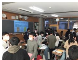
本校教員による授業