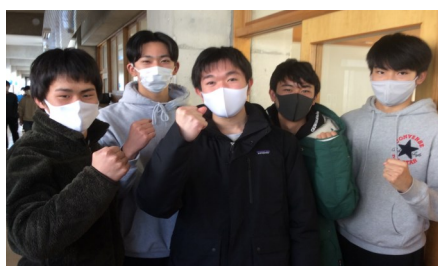
さあ行くぞ 気合いだ！

16日、17日に実施された今年が最初の大学入学共通テスト。心配された天候の乱れもなく、本校生徒たちは無事に受験を終えました。気になる本校の自己採点結果ですが、文系が667.0点、理系で625.3点の平均点でした。予想に反して全国平均点が上がる中、文系はそれを上回る大健闘をみせ、理系も例年どおりの結果をみせました。後は、保護者や担任とよく相談して