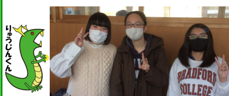
いつだってチーム三高！！

56回生の皆さん、はじめて実施された共通テスト、大変お疲れさまでした。入学した時から新入試元年といわれ、受験に関する説明会を何度も実施しましたね。制度変更など振り回されることもありましたが、無事共通テストを終えることができ、よかったです。さて、これからいよいよ個別試験に臨むことになります。まだ一カ月ありますので、体調を崩すことなく第1志望に届くようにそれぞれの力を是非発揮してください。保護者も後輩も卒業生も先生方もTeam三高として皆さんを応援しております。がんばれ、56回生！！