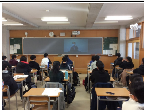
クラスでの激励会の模様です。いざ出陣！

今年の共通テストは、天候にも恵まれました。3年生にとってはいよいよ受験シーズンのスタートとなります。今年から共通テストとなり、3年生は緊張の中にも、やる気に満ちた表情をしていました。また今年はコロナの影響で、先生方による試験会場での激励はありませんでした。前日の共通テスト激励会も各教室での映像配信によるものとなりましたが、仲間との一体感と先生方の熱い激励に大いに盛り上がりました。