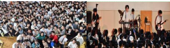
伝統のストームが復活！ (火なし)