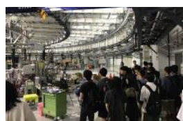
総勢約80名で見学に行きました！

そのような世界トップクラスの最新施設をぜひ三高生に見せたいということで、QST NanoTerasu総括事務局のご協力のもと、今回希望者を対象に見学会を実現することができました。当日は生徒と教職員合計約80名で見学しました。通常の見学では難しいビームラインの近くまで見学でき、世界標準の最新研究施設を肌で感じ、放射光施設への理解を深めました。本校の生徒からも将来このような施設を活用して世界で活躍する人が輩出されることを期待します。