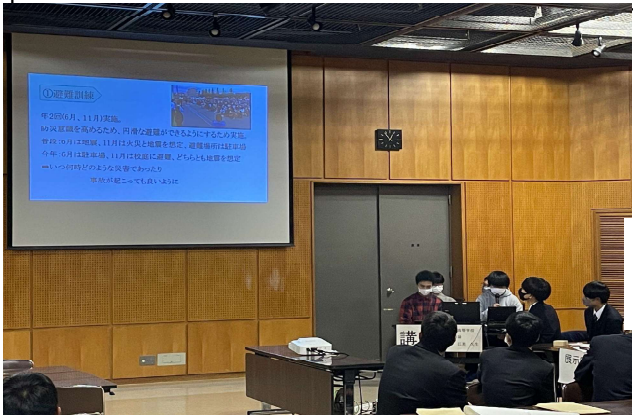
←防災ジュニアリーダー発表の様子

多賀城高校で行われた外部イベントである3.11メモリアルday2023に参加してきました。 宮城県内の学校だけではなく県外の高校の探求からもインスピレーションを受けることで探究活動をより良いものにすることができました。