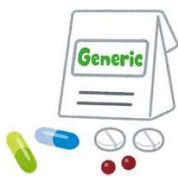
ジェネリック医薬品 (薬剤費減)