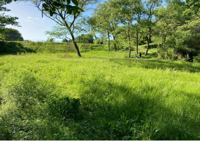
写真1 現在の大堤沼公園の様子

インクルーシブ公園とは、、、障がいのあるなし、子どもから大人まで、すべての人が利用できる公園のこと