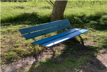
写真2 公園唯一のベンチ