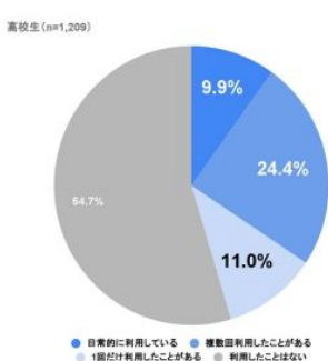
全国でのChatGPTの使用率