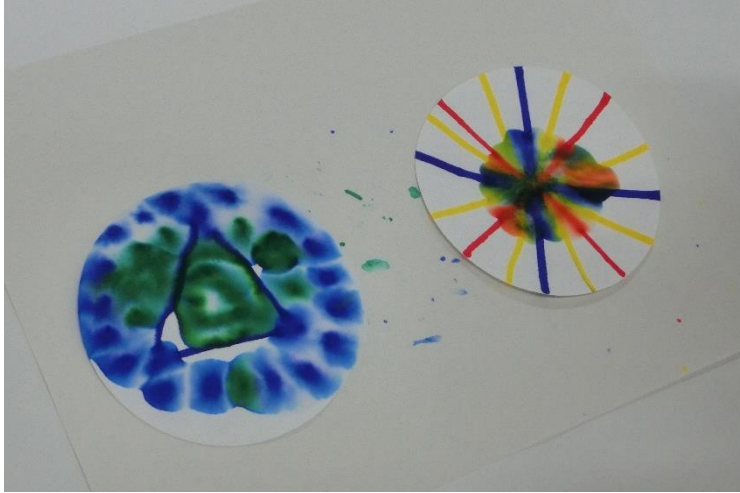
クロマトグラフィーの作品