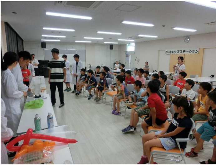
液体窒素 次はどんな現象が起きるかな～

8月6日(火) 鶴ヶ谷市民センターにてわくわくサイエンスを実施してきました。昨年度は、空気砲、空気圧、七夕工作でした。今年の内容は、液体窒素、クロマトグラフィー、きらきらシャボン玉です。クロマトグラフィーでは色によって濡れた紙をにじむスピードが違うことを利用して作品を作りました。思い思いの作品ができました。中には芸術的な作品も見られ、子どもの豊かな感性を感じることができました。きらきらシャボン玉は、一見クラゲのような作り物ですが、回すシャボン玉のように見えます。できあがると子どもたちは夢中で回していました。夏の良い思い出となったと思います。