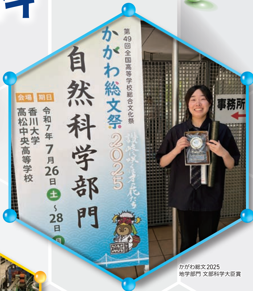
かがわ総文2025 地学部門 文部科学大臣賞