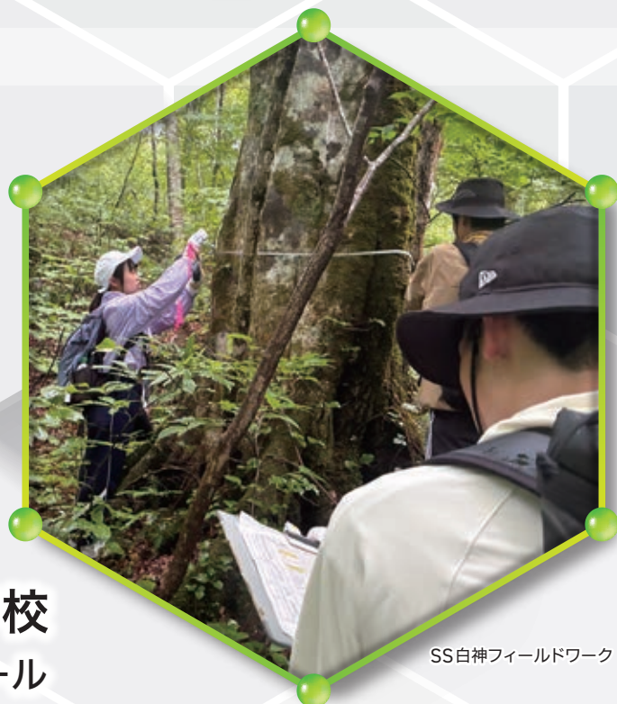
SS白神フィールドワーク