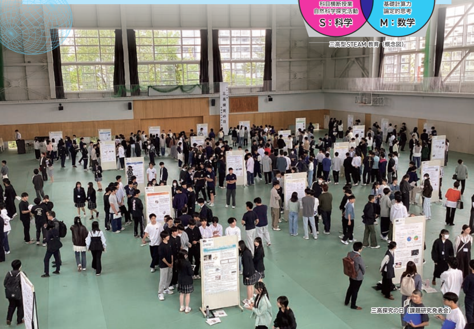
SSH探究の日 (課題研究発表会)