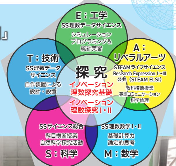
三高型STEAM教育 (概念図)

理数科では、他の教科・科目と融合した「学校設定科目」(三高型STEAM教育)に取り組むことで、これからの社会で求められている課題発見・解決力や論理的思考力など研究に必要な素養を身につけることができます。