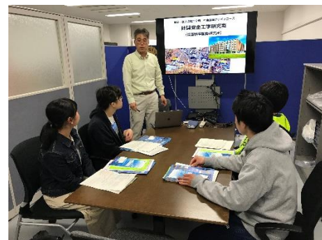
建築・社会環境工学科社会基盤デザインコース