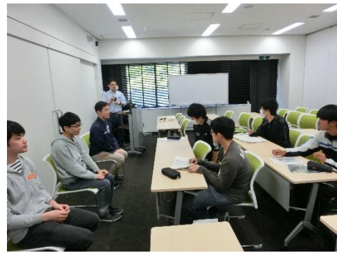
材料科学総合学科材料システム工学コース